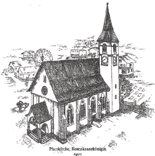
Pfarrkirche, Rosenkranzkönigin Agarn