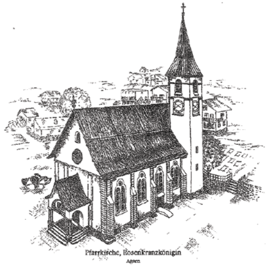
Pfarrkirche, Rosenkranzkönigin Agarn